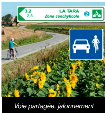
Voie partagée, jalonnement