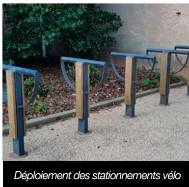
Déploiement des stationnements vélo