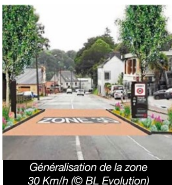
Généralisation de la zone 30 Km/h