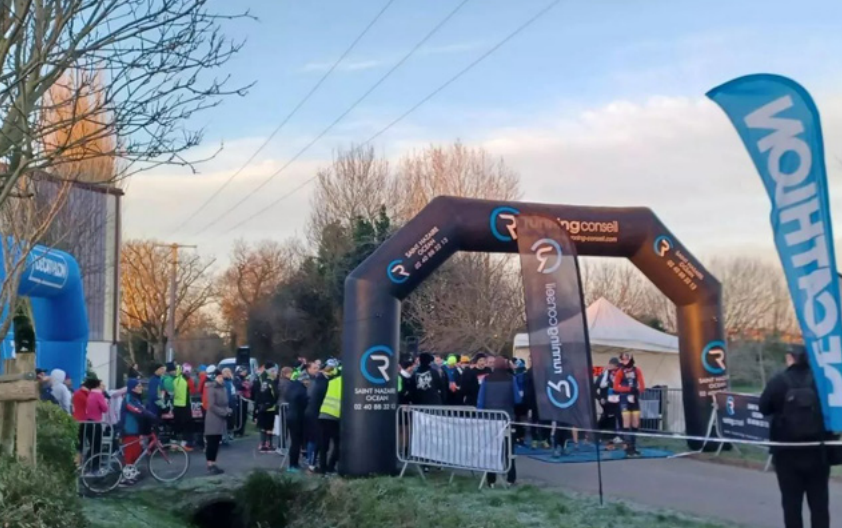
© Team 3D Montoir de Bretagne

Retrouvez toutes les informations et actualités de l'association sur leur page Facebook « Team 3D Montoir-de-Bretagne ».