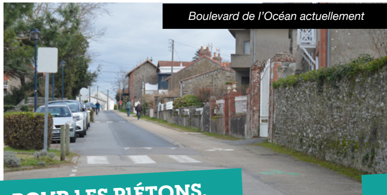
Boulevard de l'Océan actuellement