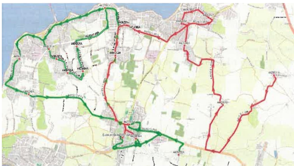
Itinéraires des cars primaires